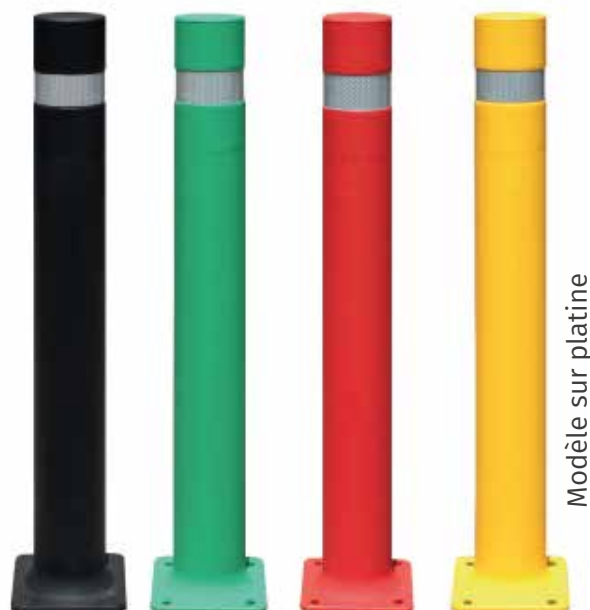
Modèle sur platine